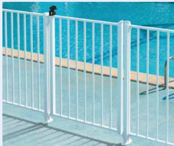
Portillon à fermeture automatique. Poignée à double action.